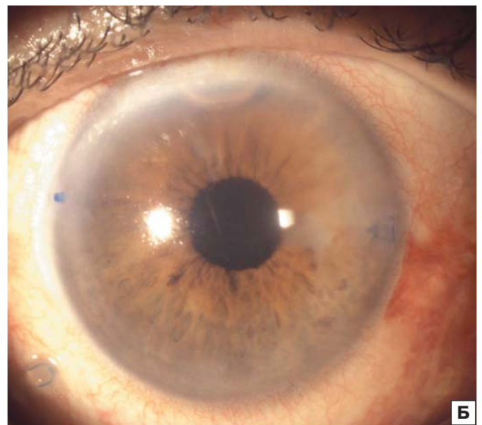
Рисунок. Правый глаз пациента М. до (А) и после (Б) операции Figure. Patient M.'s right eye before (A) and after (B) surgery